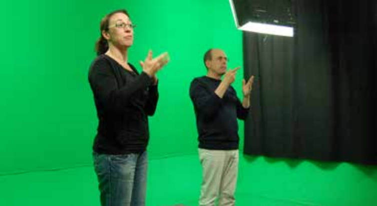
SignGes Videoproduktion in Gebärdensprache